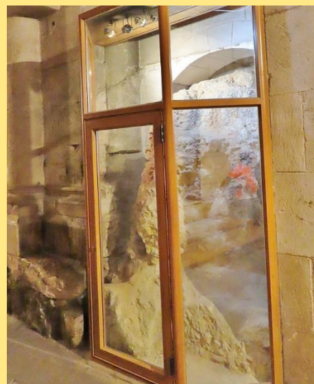
Jerusalem, Grabeskirche: Golgotha-Felsen