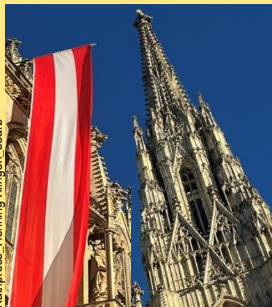
Kathpress, Henning Klingens, bearb

Gebt dem Kaiser, was dem Kaiser gehört und Gott, was Gott gehört. Aber was gehört wem?